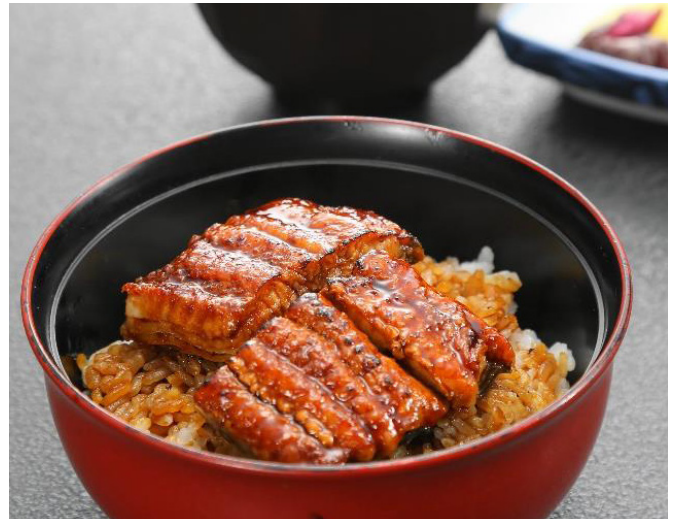
小うな井 (吸い物・香物付)