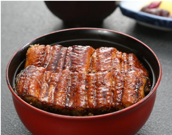
中うな井 (吸い物・香物付)