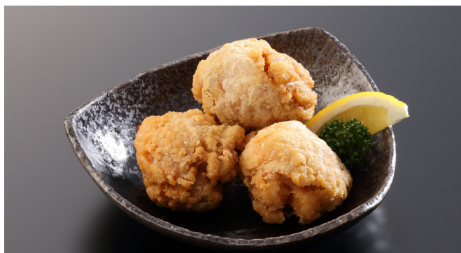
秋間梅の鶏唐揚げ