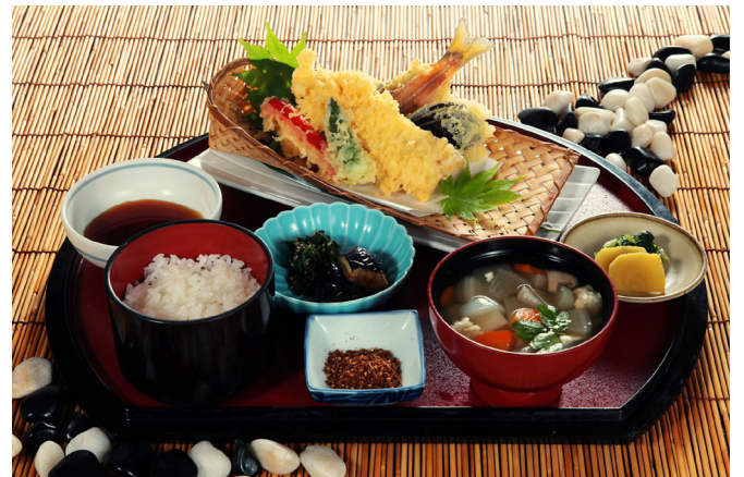
鮎の天婦羅 or フライ御膳