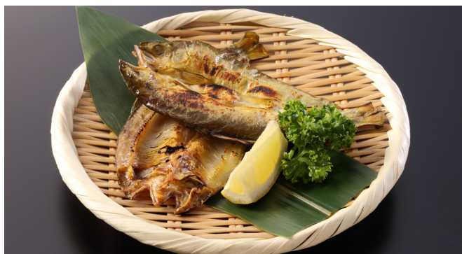
自家製 鮭の一夜干し