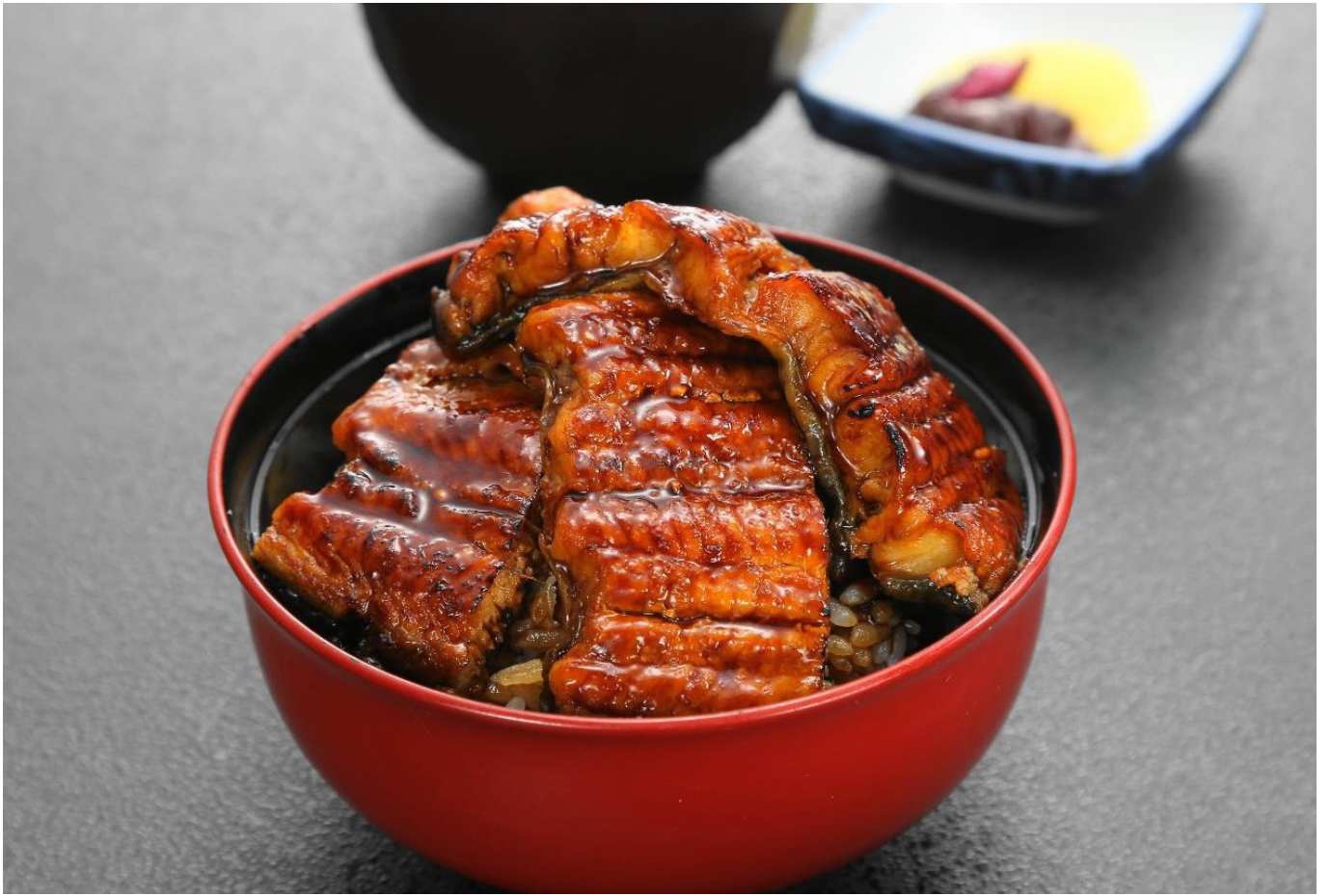
妙義盛りうな井 (吸い物・香物付)